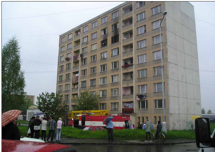
Rimavkosobotskí hasiči v minulom roku zasahovali aj pri požiaroch neslávne známej bytovky na Dobšinského ulici.

V priebehu minulého roku vykonali členovia Hasičského a záchranného zboru v Rimavskej Sobote 414 výjazdov. Z nich bolo najviac k tzv. technickému zásahu – 268, z toho najčastejšie k dopravným nehodám (113), k otváraniu bytov (90), technickej pomoci (31), k protipovodňovým prácam (10), atď. Ako uvádza na piatej strane, 122 výjazdov bolo k požiarom, desať výjazdov bolo k planému poplachu, osem k cvičeniam a šesť k ekologickým zásahom.