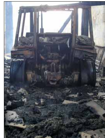
Pri požiaru ovčína v Klenovci bola zničená aj technika.

V prvých štyroch dňoch tohto roku realizovali rimavskosobotskí hasiči už šesť výjazdov. Dva k dopravným nehodám (pri Ratkovskej Suchej, resp. Tisovci), po jednom k požiaru (Klenovec), otváraní bytu (na Sídlisku Rimava upozornili obyvatelia bytovky na dlhšiu neprítomnosť susedky-starenky, po otvorení bytu bola nájdená v zlom zdravotnom stave), k utopenej osobe v Rimave v Hnúšti, jeden bol planý poplach.