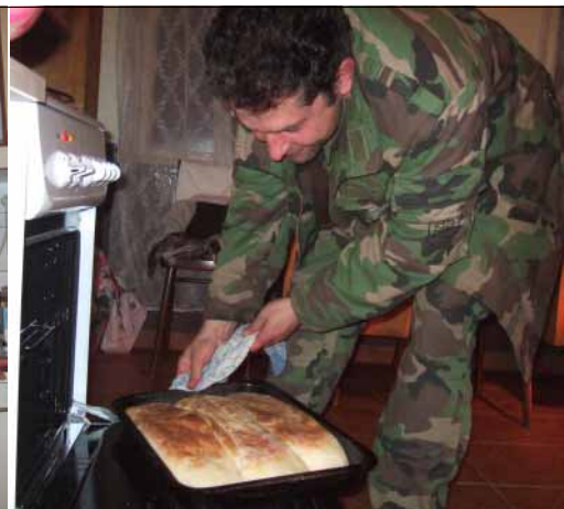
Pečenie vianočných sladkostí na predštedrovečné stretnutie vo V. Skálniku nebolo čisto ženskou záležitosťou.

Vo Vyšnom Skálniku spomínali na krajšie prežité sviatky