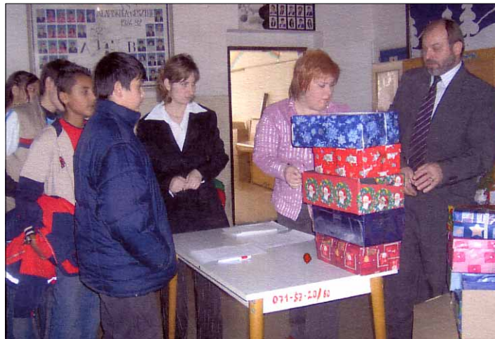
Deti z Hostíc sa darčekom z Nemecka pochopiteľne potešili.

Týmto projektom bolo umožnené 35 občanom prežiť atmosféru a čaro Vianoc. Pri spoločnom stole sa stretli ľudia s rovnakým nelichotivým osudom. Projekt bol zrealizovaný vďaka finančnej podpore Konta Orange, n. o., z programu Darujte Vianoce.