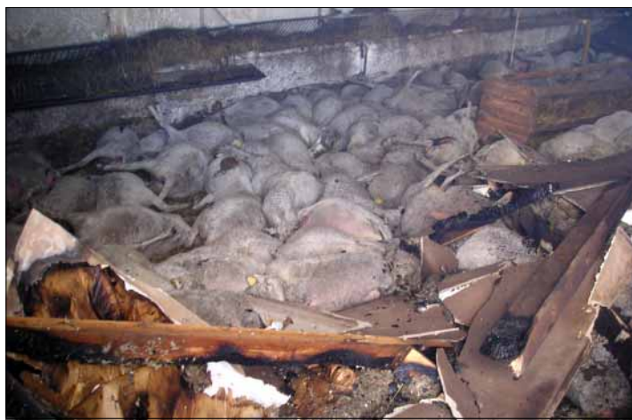
Smutný pohľad na uhynuté ovce Roľníckeho družstva Klenovec.

mí mesta Rimavská Sobota. Pri 64 požiaroch vznikli priame škody 5,7 mil. Sk, usmrtená bola jedna osoba a zranených päť osôb. V meste Hnúšťa vzniklo trinásť požiarov so škodou 50 500 Sk, v Jesenskom osem požiarov do škodou 59 000 Sk, v Tisovci šesť požiarov so škodou 126 500 Sk, atď. V nevelkej obci Uzovská Panica vznikli tri požiare so škodou 149 tis. Sk, žiaľ, pri jednom z nich bola usmrtená jedna osoba. Zvyšné dve osoby z celookresnej štatistiky boli zranené pri požiaroch v Ožďanoch.