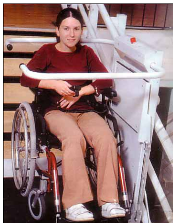
Takýto schodolez by pomohol telesne postihnutým.

nie je zabezpečená bezbariérovosť. Pritom EÚ kladie dôraz na to, aby