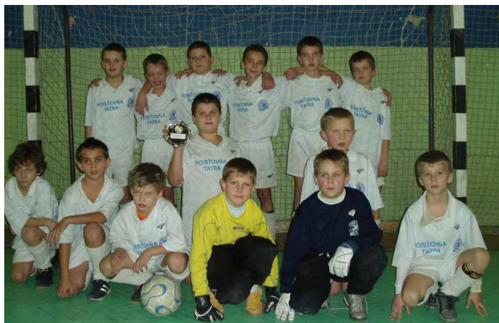
Mladí futbalisti ŠK Tempus Rimavská Sobota, roč. nar. 1997.

Mladší žiaci : Putnok 2:4, góly : Balciar, Demjén; Revúca 1:2, gól : Petrus; FC Rimavská Sobota 0:3; Rožňava 3:3, góly : Uličný 3. Konečné