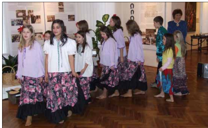
Vernisáž výstavy spestrilo vystúpenie súboru Hrachovčan.