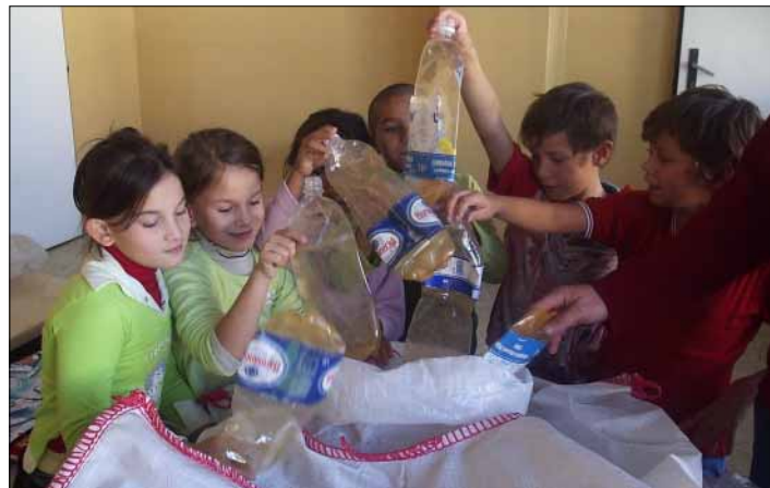
Do separovaného zberu sa zapájajú najmä žiaci školy.