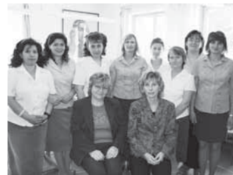
Absolventky rekvalifikačného kurzu

ale aj vedieť primeraným spôsobom v skupine presadiť svoje potreby. I to sú nevyhnutné predpoklady pre získanie a udržanie si zamestnania. „Na začiatku kurzu sa často stretávame s obavami účastníčok, ako budú zvládať rodinu, domácnosť a zároveň rekvalifikáciu. Snažíme sa im vysvetľovať, že všetko je len otázkou efektivity práce a správ-