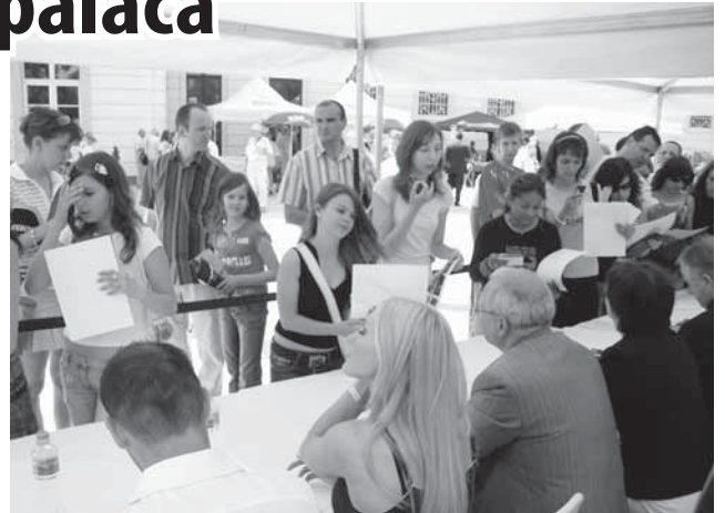
Naši ôsmaci počas autogramiády prezidentského páru

Jún patrí medzi mesiace, keď je nemsierne teplo. Inak tomu nebolo ani v tento deň. No organizátori boli pripravení na všetko. Na zadnom nádvorí sa na každom kroku nachádzal stánok s občerstvením ako pre deti, tak aj pre dospelých. Keď sme vyčerpali skoro celý program, rozhodli sme