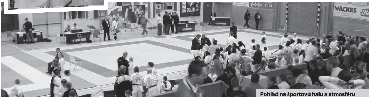
Pohľad na športovú halu a atmosféru

Rimavskosobotskí karatisti tak skvele zakončili súťažnú sezónu 2006/2007 a patrí im poďakovanie za reprezentáciu nášho mesta. Po- ďakovanie patrí aj všetkým sponzo- rom, prispievateľom a priaznivcom nášho klubu, bez ktorých podpo- ry by účasť detí na športových podujatiach počas celej súťažnej sezóny nebola možná. „A čo do- dať na záver? Za odmenu sa boli všetky deti „vybláznit“ v jednom z najväčších zábavných parkoch TIVOLI v Kodani a naša úspešná cesta sa skončila spoločnou fotkou medailistov pri dánskom skvoste Malej Morskej Víle,“ povedal na záver tréner V. Molnár.